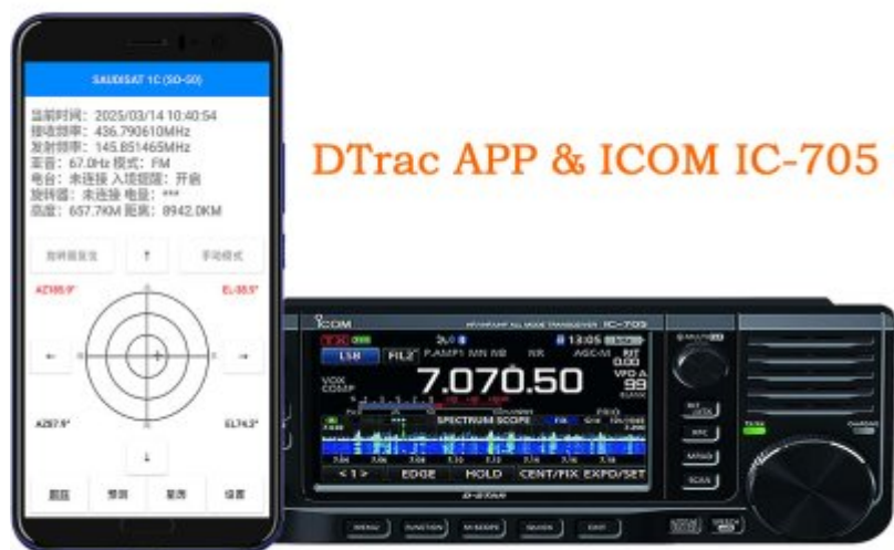
DTrac APP & ICOM IC-705