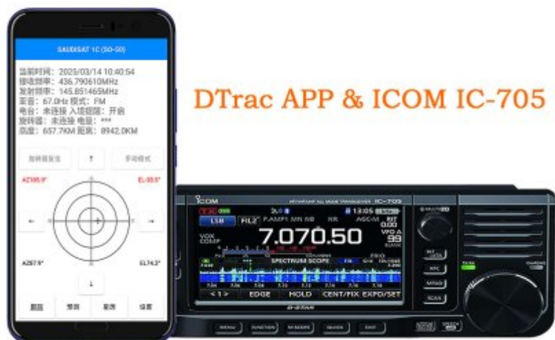
DTrac APP & ICOM IC-705