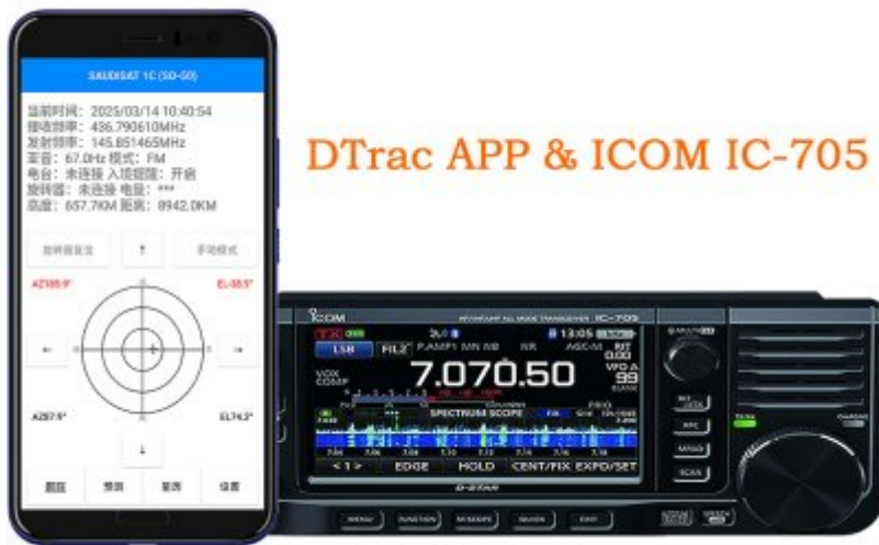
DTrac APP &amp; ICOM IC-705